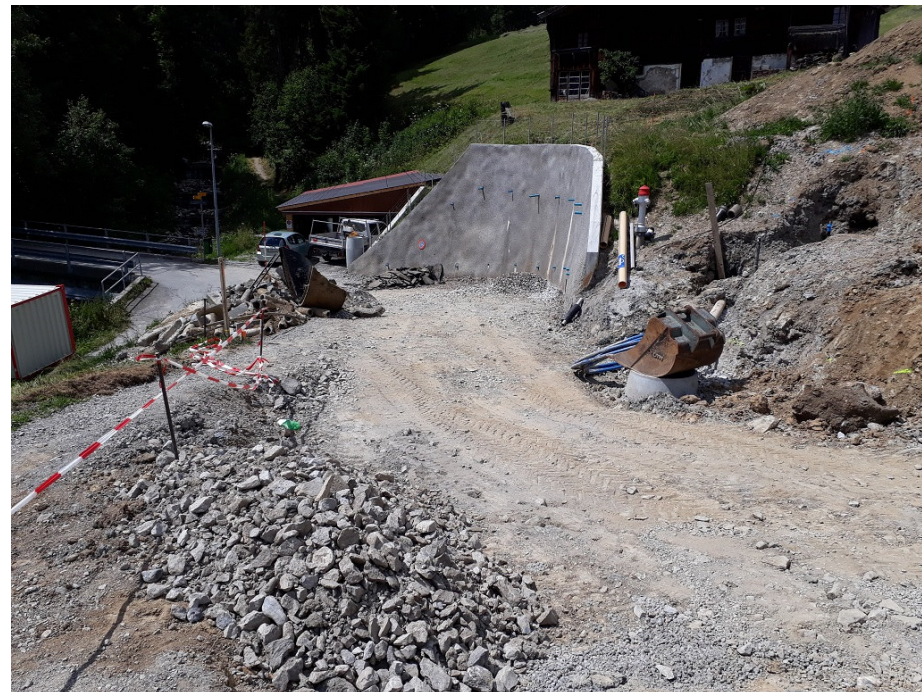
Nagelwand und Unterbau Strasse

BAUPHYSIK VERMESSUNG SPEZIALTIEFBAU KANALISATIONEN WASSERVERSORGUNG