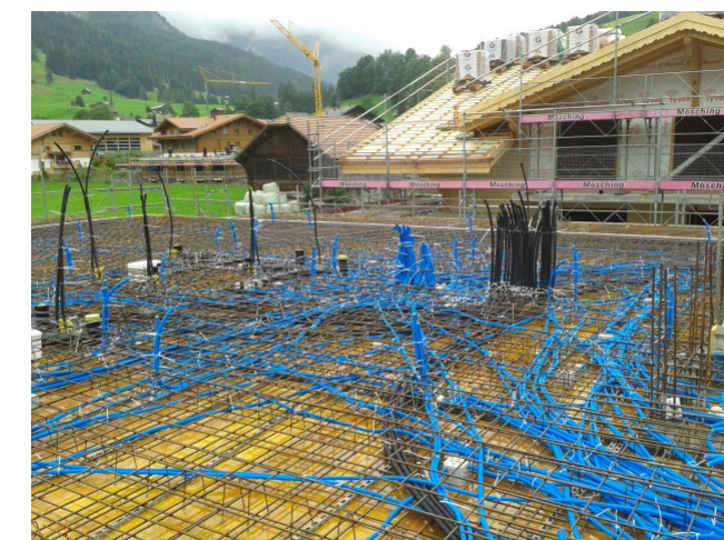
Armierung Decke über OG Haus B